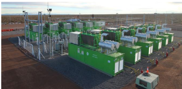
Loma Campana Este

Loma Campana Este se construyó en 6 meses y se inauguró en julio de 2017. El diseño, provisión, construcción, montaje y puesta en marcha de las instalaciones de la Central estuvo a cargo de YPF Luz.